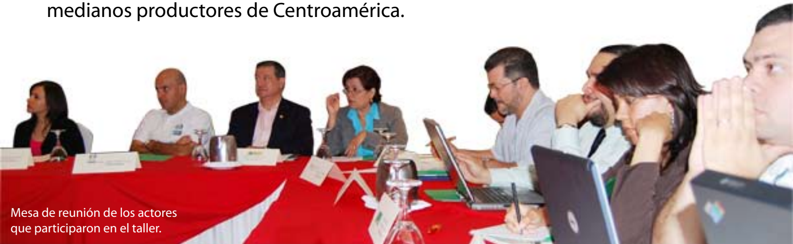
Mesa de reunión de los actores que participaron en el taller.

Agencias de Promoción y Exportaciones (Apex) se unen para promover las exportaciones del sector orgánico y de comercio justo de los pequeños y medianos productores de Centroamérica.