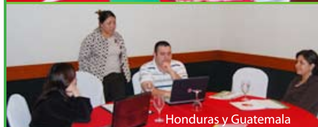
Honduras y Guatemala